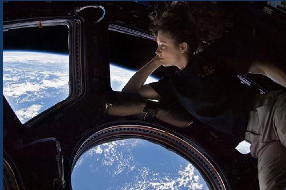
L'astronaute Tracy Ellen Caldwell Dyson se reposant dans la coupole de l'ISS,

... pour encourager un exploit de l'aventure humaine